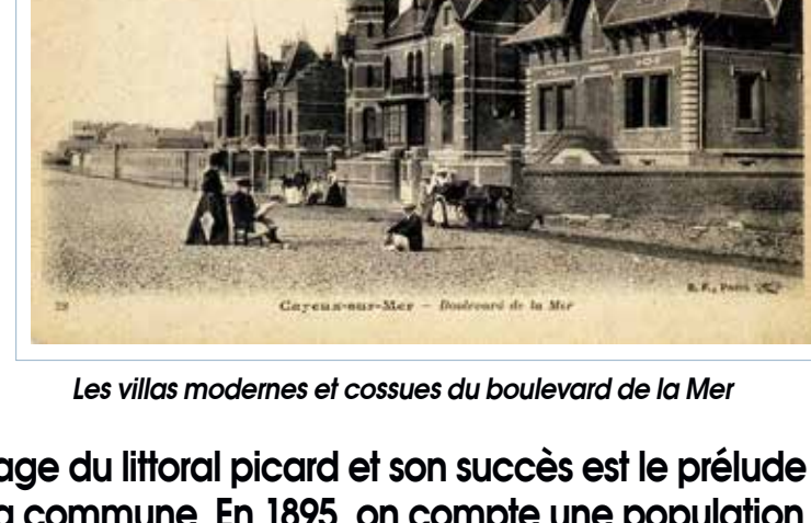
Les villas modernes et cossues du boulevard de la Mer

Cayeux est la première plage du littoral picard et son succès est le prélude à une période faste pour la commune. En 1895, on compte une population de 3 300 habitants et de 3 000 estivants.