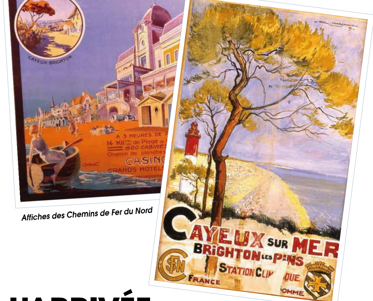
Affiches des Chemins de Fer du Nord