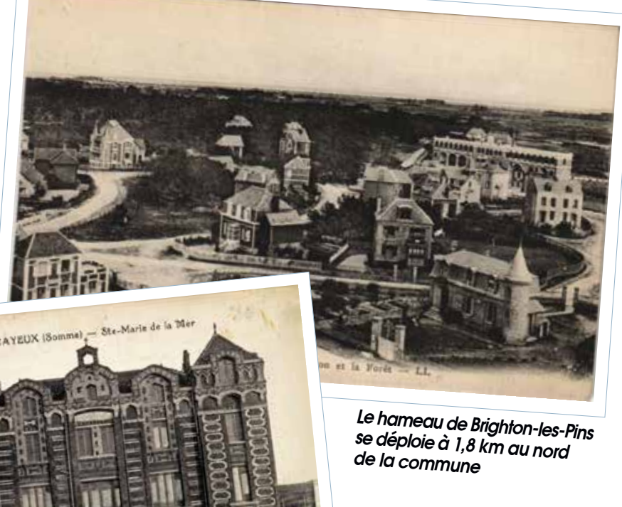
Le hameau de Brighton-les-Pins se déploie à 1,8 km au nord de la commune

Au nord de la commune, le hameau de Brighton-les-Pins se développe proposant de belles villas et des hôtels.