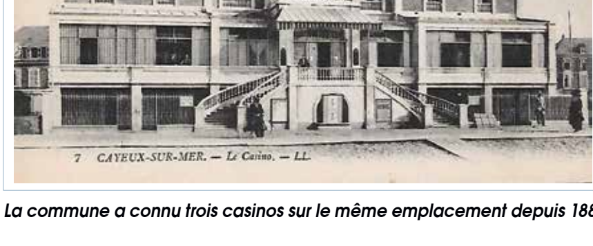
La commune a connu trois casinos sur le même emplacement depuis 1880