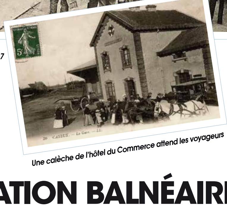
Une calèche de l'hôtel du Commerce attend les voyageurs