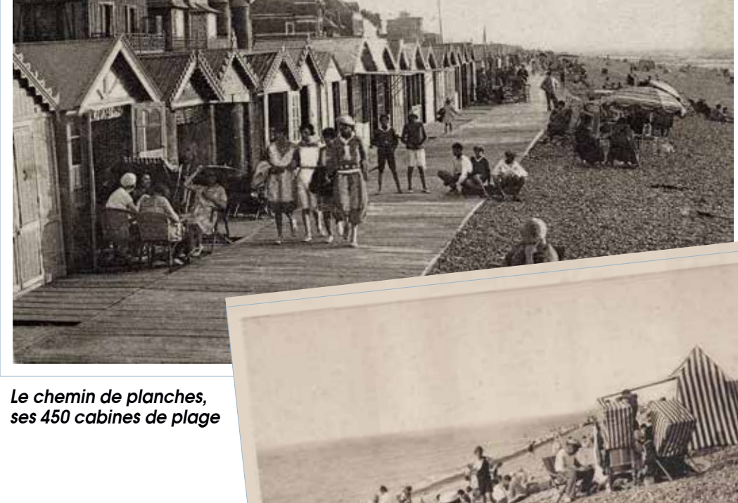
Le chemin de planches, ses 450 cabines de plage

Bien installé dans sa cabine qui a les planches, il n'est pas nécessaire de se déplacer jusqu'aux boutiques car une vente ambulante est organisée.