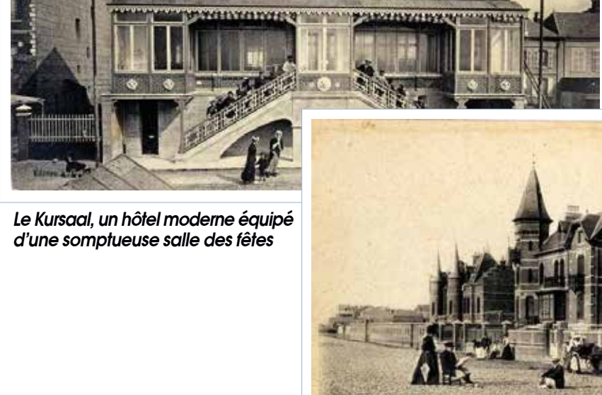
Le Kursaal, un hôtel moderne équipé d'une somptueuse salle des fêtes