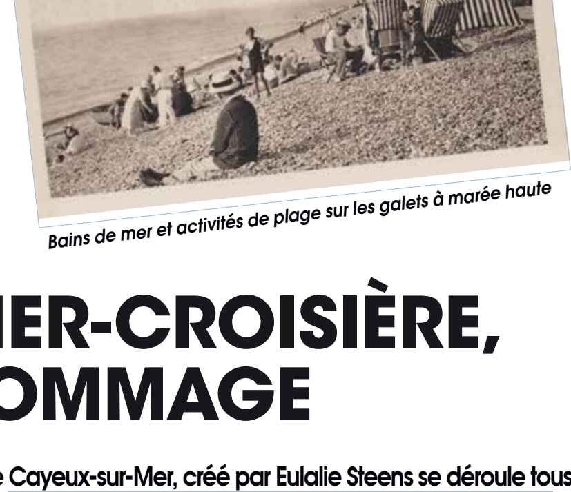
Bains de mer et activités de plage sur les gallets à marée haute