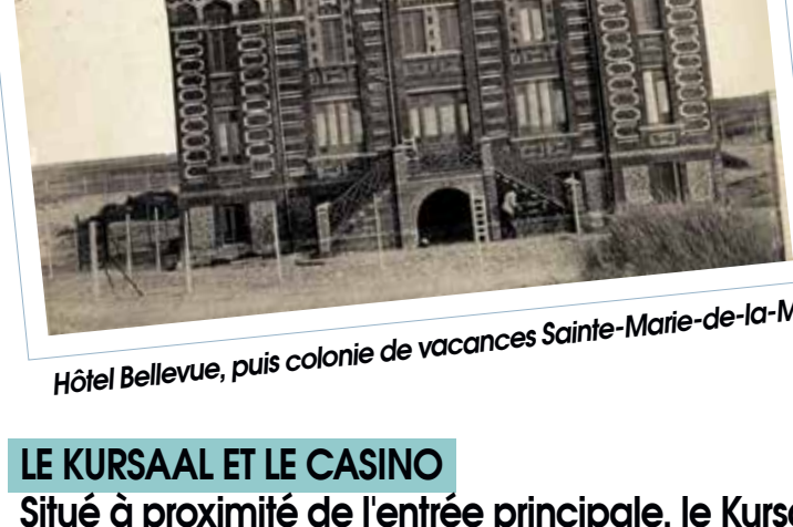
Hôtel Bellevue, puis colonie de vacances Sainte-Marie-de-la-Mer