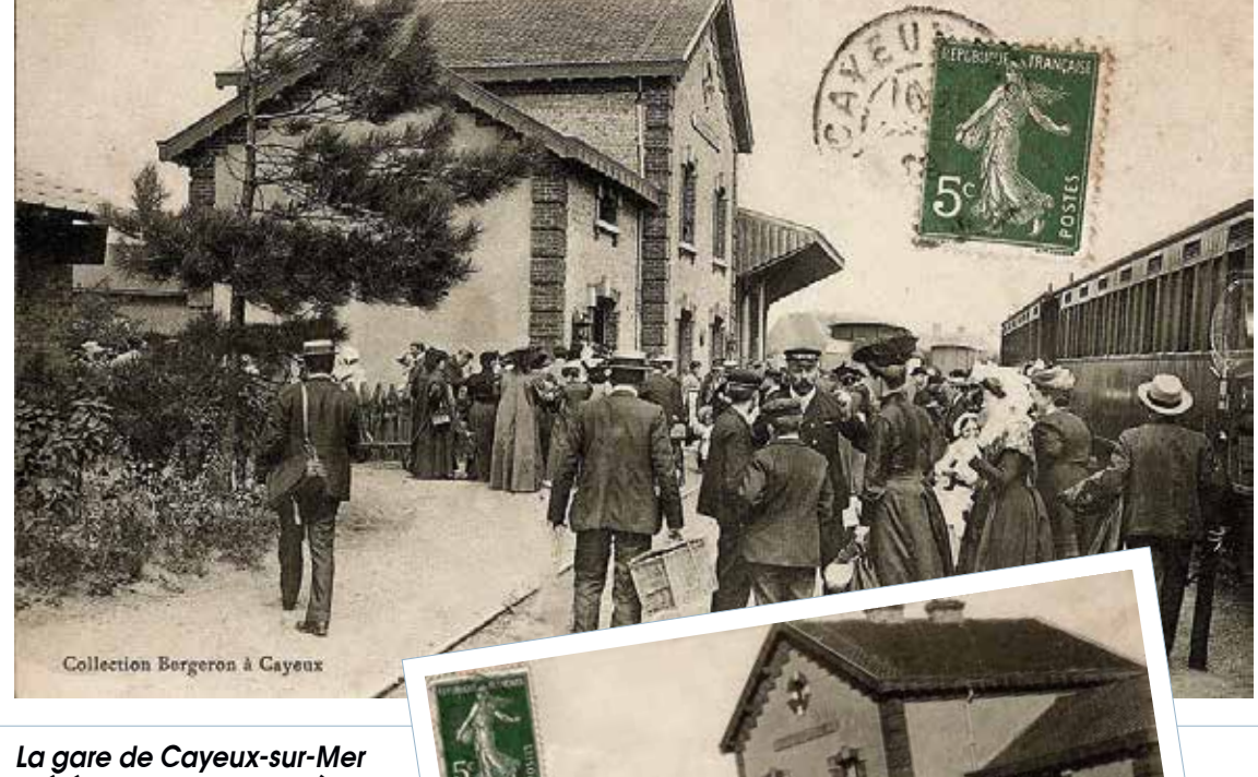
La gare de Cayeux-sur-Mer a été mise en service dès 1887

L'ouverture de la ligne de chemin de fer reliant Cayeux à Saint-Valery, le 6 septembre 1887, permet désormais un accès aisé à cette station balnéaire déjà très en vogue.