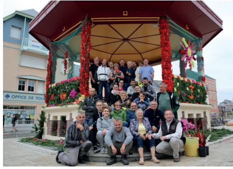
15 août Décoration du kiosque pour la fête des fleurs. Une belle équipe !