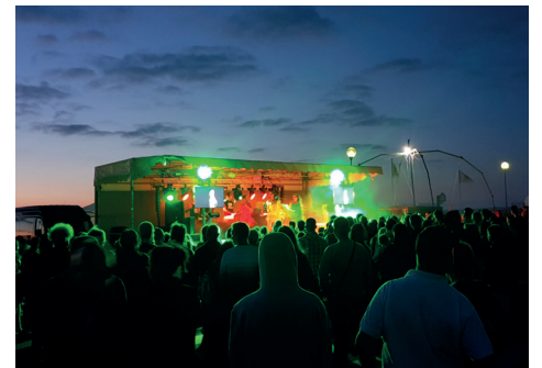
15 août Podium 9P Production.