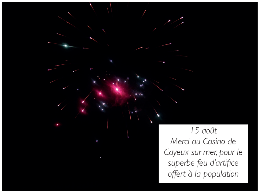
15 août Merci au Casino de Cayeux-sur-mer, pour le superbe feu d'artifice offert à la population