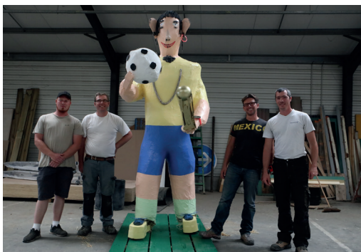
25 août Renouant avec une ancienne tradition, Cayeux a fêté le Père cafard. Une immense marionnette en papier-carton a déambulé dans les rues de la ville avant d'être embrasée au stade. Le personnage réalisé en secret par les Services municipaux était un joueur de foot.