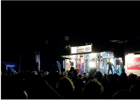
10 août Podium Chérie FM avec la participation de Jean-Luc Lahaye.