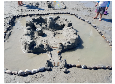
Sur la plage en été, des concours de châteaux de sable, de dessin à la craie, mais aussi - et ce fût très apprécié - de stone balancing qui est l'art d'équilibrer des pierres ou des galets !