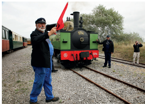
15 août Fête de la gare. À toute vapeur !