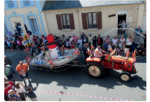
Défilé du corso fleuri devant le jury et dans les rues de la ville.