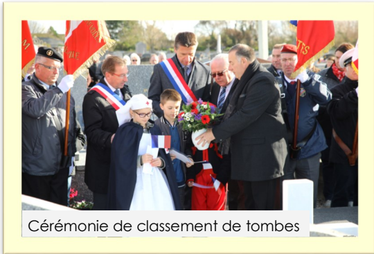
Cérémonie de classement de tombes