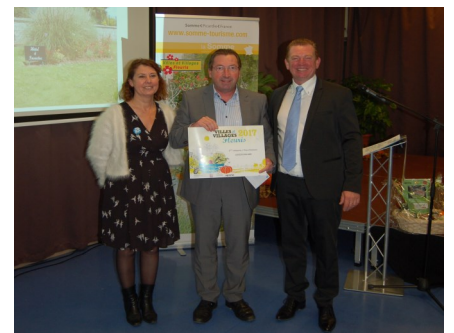
Remise du prix d'honneur « villes et villages fleuris » le 21 novembre en présence de M. Franck Beauvarlet, président de Somme Tourisme.