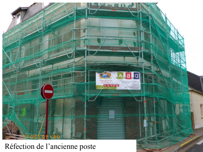
Réfection de l'ancienne poste

Tout doucement notre ville s'embellit et permet un accueil touristique de qualité.