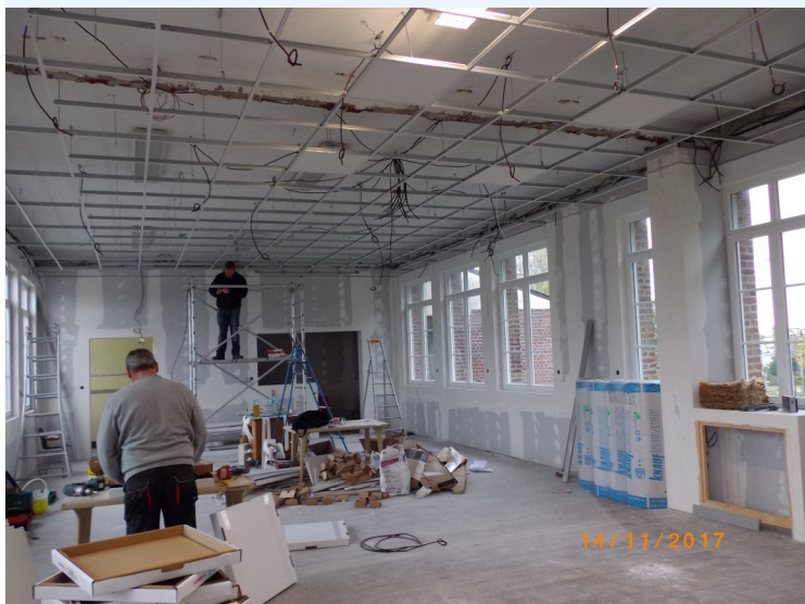
Début des travaux intérieurs à la salle de La Mollière

Les travaux de la salle de la Mollière continuent après le montage de fenêtres isolantes de qualité.