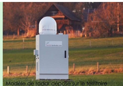
Modèle de radar déposé sur le territoire

L'évolution de la technologie radar constitue un grand avantage pour étudier de manière localisée les mouvements de l'avifaune. Le principe est basé sur l'émission d'une onde qui lorsqu'elle heurte une cible revient à la station d'émission. Grâce à des spécificités techniques, il est possible à présent de dissocier les groupes d'espèces en fonction de leur comportement de vol. De manière complémentaire aux dénombrements visuels, l'avantage de cet outil réside dans le fait que les enregistrements peuvent se faire de manière continue 24h/24h.