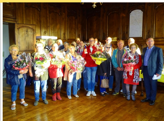
Remise des prix du concours maisons fleuries