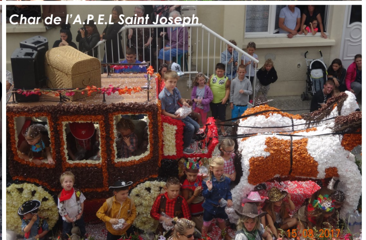
Char de l'A.P.E.L Saint Joseph

Gros succès pour cette édition 2017 de la Grande Fête des Fleurs , puisque 17 chars fleuris (au lieu de 8 en 2016) ont participé cette année à ce traditionnel évènement. La foule, nombreuses, était bien sûr au rendez-vous et l'ambiance festive, sous un beau soleil. Merci à tous les participants qui ont fait de cette Fête des Fleurs une réussite. Merci également à Monsieur Debrouille d'avoir participé au corso fleuri avec son groupe de voitures anciennes.