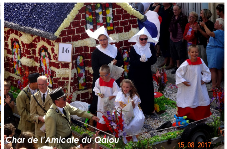
Char de l'Amicale du Qaiou