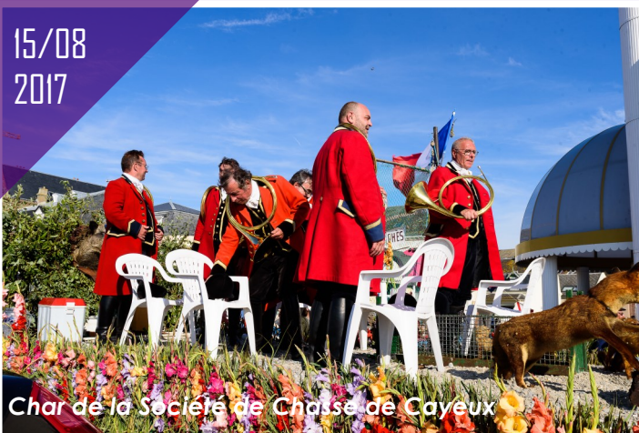
Char de la Société de Chasse de Cayeux