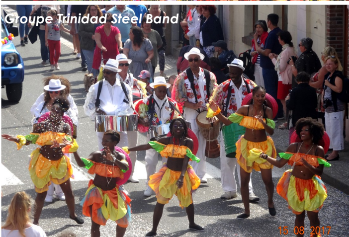
Groupe Trinidad Steel Band