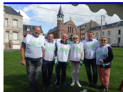
Opération «nettoyons la nature»