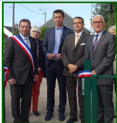
Inauguration de l'aire de jeux du square René Ouin