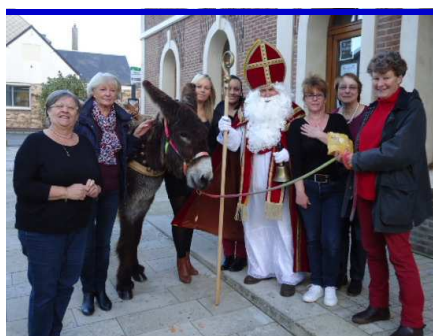
Saint Nicolas 2015