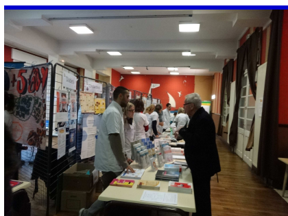
Journée prévention des risques cardiovasculaires